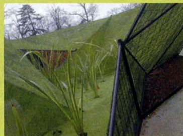
A l'abri des grimptentes (école d'architecture Paris-Belleville)