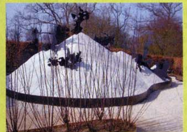
Pour Imaginoir (Houadec/Mikulasova), apportez seau et pelle !