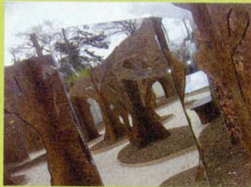
Cache-cache entre arbres et miroirs, vrai et faux (Arpents paysages).