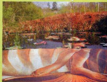
Le jeu de Venus et du hasard, Avrabou.